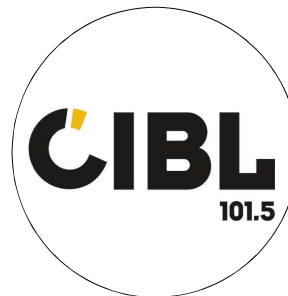
CIBL 101.5 Entrevue radio à l'émission « Le retour »