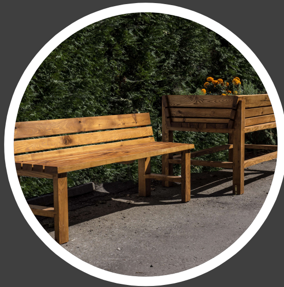
Banc et bacs à fleurs Client : P.A.R.I. Saint-Michel Fabrication : Groupe Information Travail