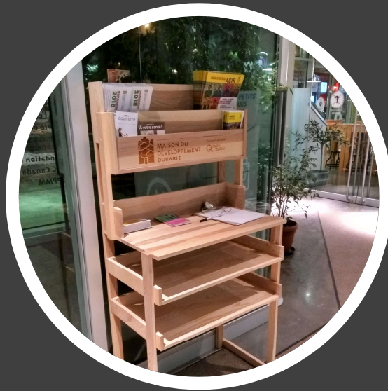
Présentoir Client : La maison du DD Fabrication : Les ateliers d'Antoine