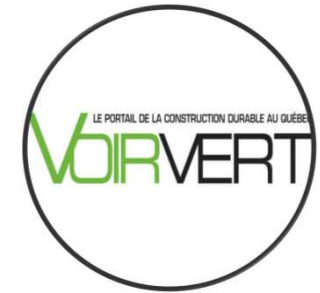
Voir Vert Des mobiliers en frêne dans les ruelles vertes