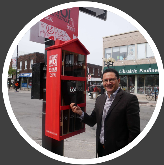
Boîte à sacs réutilisable Client : Promenade Masson Fabrication : Les ateliers d'Antoine