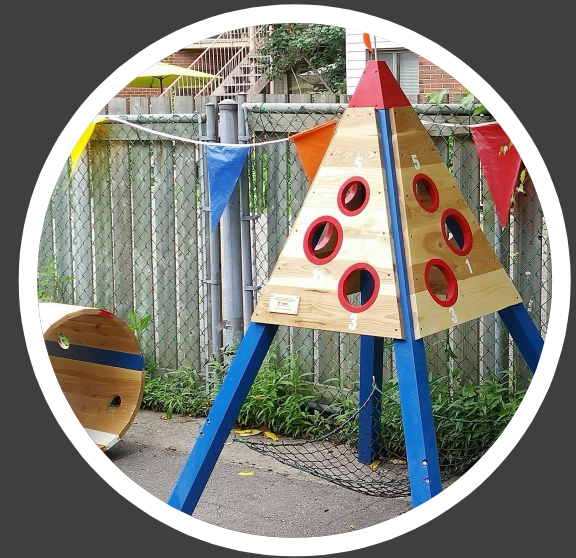
Modules de jeu pour ruelles vertes Client : Regroupement des éco-quartiers Fabrication : Les ateliers d'Antoine