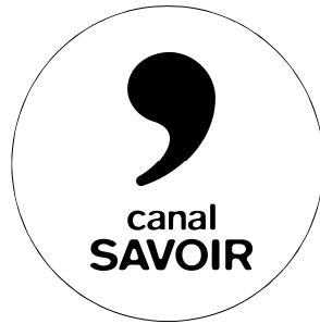
Canal Savoir Série : Univert urbain. Épisode sur l'économie circulaire