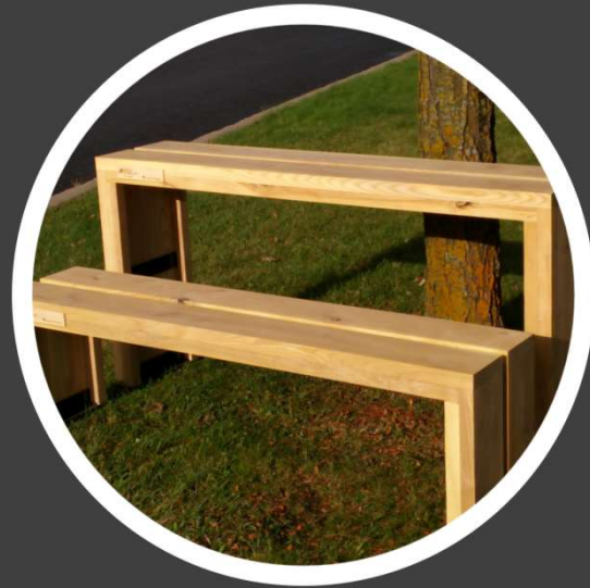
Banc et table modulables

Client : Arr. Rosemont-Petite-Patrie Fabrication : Les ateliers d'Antoine