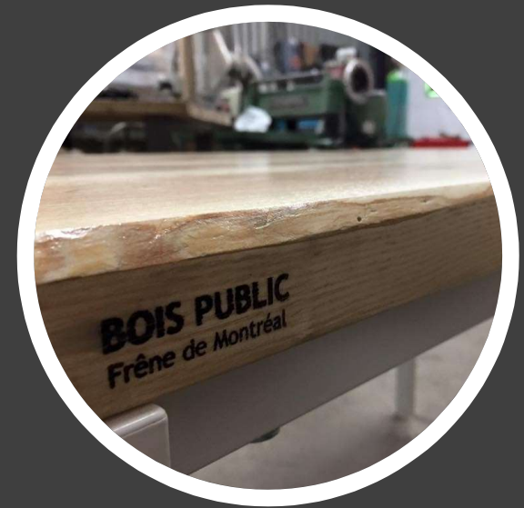
Table de conférence Client : Baléco Fabrication : Bois Public