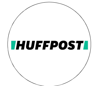
Huffington Post Des projets inusités pour recycler les arbres malades de Montréal et en faire du mobilier