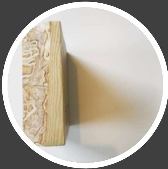
Trophée BOMA Client : Kotmo Fabrication : Les ateliers d'Antoine